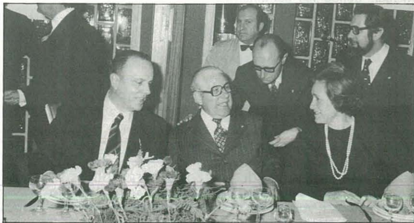
Fraga, Forcadell y la esposa del entonces Gobernador Civil de Soria, presiden un importante acto celebrado en la capital del reino

— CREAR UN CENTRO SANITARIO EN TERRENOS PROPIEDAD DEL AYUNTAMIENTO.